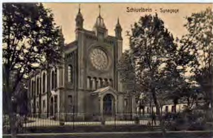
Synagoga, w tym miejscu zbudowano galerię Hosso

wał Świdwinem ponad 20 lat, ustąpił ze względów zdrowotnych. Jego następcą został Theodor Duerren. Pełnił funkcję do 1945 roku. W nocy z 9 na 10 listopada spłonęła synagoga zbudowana w 1880 roku w stylu neoromańskim przy ulicy Glasnappa (Wojska Polskiego) – róg Neustadtstrasse (Nowomiejska), podpalona przez członków SA i SS; równocześnie został sprofanowany cmentarz żydowski przy drodze do Polchlep (Półchlep). Straż Pożarna miała rozkaz bronić tylko sąsiednie zabudowania. Mury synagogi zostały wysadzone, kamienie zostały użyte do naprawy dróg. Na działce wielkości 11 500 metrów kwadratowych założyło miasto zieleńiec – ogród dalii. W tym miejscu miał być później zbudowany nowy ratusz. Żydowskie rodziny, pod nieustannym naciskiem partii i państwa, już wcześniej wywędrowały z miasta, przede wszystkim do Palestyny i Ameryki Południowej albo zostały wywiezione.