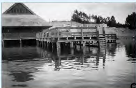
Bukowiec w trakcie budowy

ZAPISKI Z HISTORII ŚWIDWINA OD 1930 DO 1945 ROKU cz. II